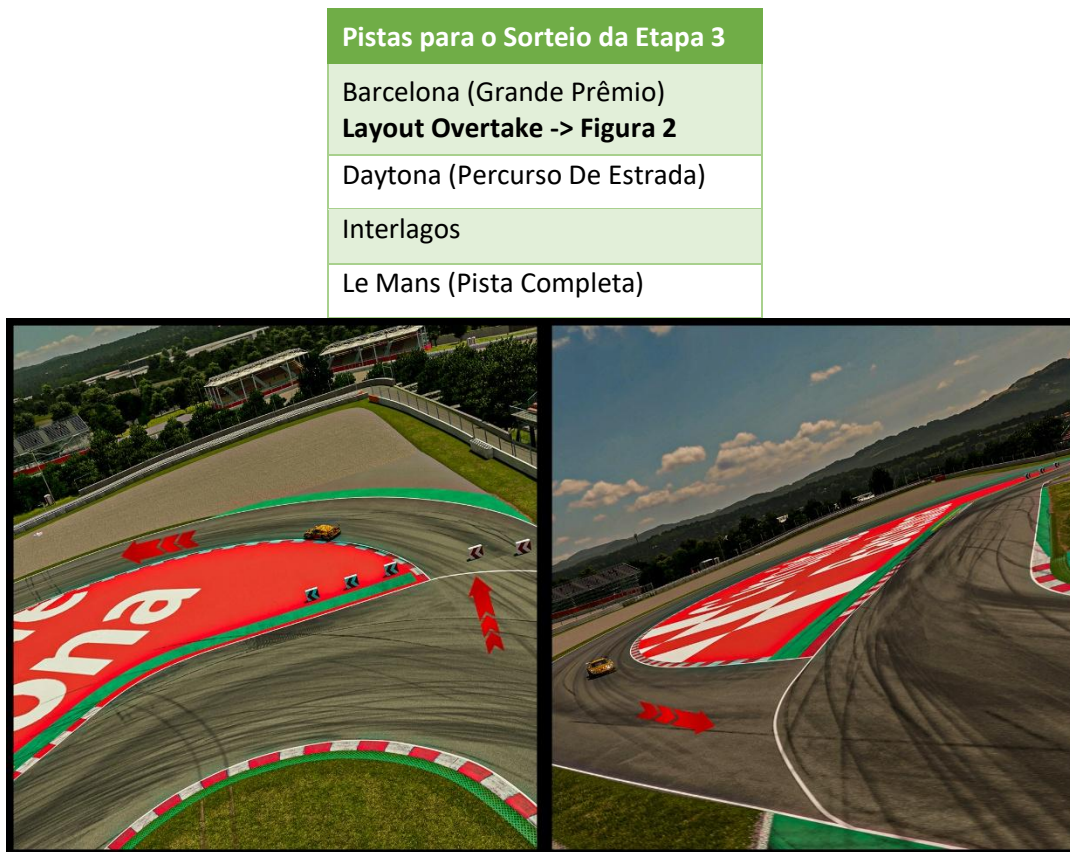
Figura 2 - Layout Overtake para Barcelona, disponível em: https://www.youtube.com/watch?v=cfKwYT54DoE