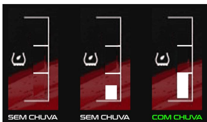
Figura 1 - Condições para ser considerada corrida com chuva.

2.3.6. As corridas serão realizadas no seguinte formato, salvo exceções da Tabela 1 e/ou Tabela 8: